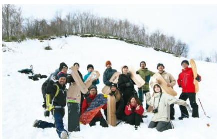
昨年のモニターツアー集合写真