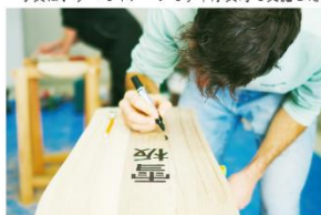
雪板づくりクラフト体験

・写真は、すべてイメージです「厚真町で実施した雪板モニターツアーの様子より（2023）」