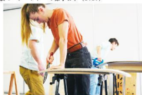
雪板づくりクラフト体験