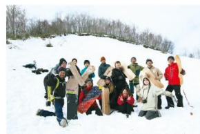
モニターツアー集合写真