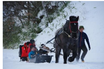
珍しい馬搬の林業見学の様子

新千歳空港からアクセスしやすい「北海道厚真町」は、スノーサーフィンが盛んである一方豊かな森林資源をもち、厳しい雪山での伐採、馬で木を運ぶ伝統的な馬搬など、ここでしか見られないユニークな林業が行われている町です。また、町で育った木を加工する製材屋もあり、「木を伐る→つかう→育てる」という森の循環サイクルが実現していることも特徴です。