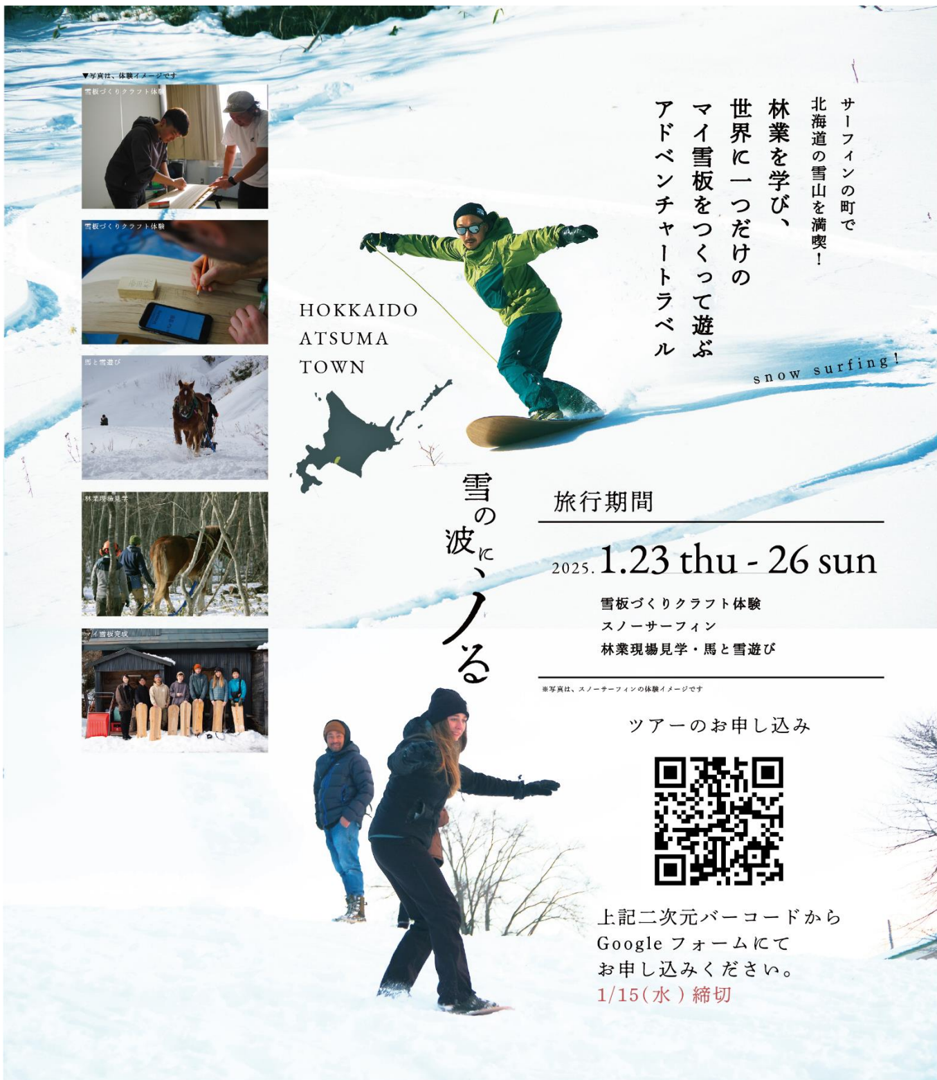
▼写真は、体験イメージです