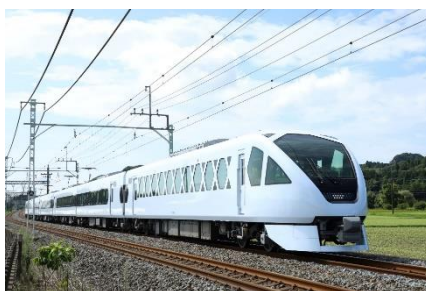
東武特急スペーシア X