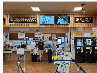
東武日光駅観光センター

LINKTIVITY 社のプラットフォームにより、インバウンド旅行者は日本へ到着前の旅マエに、希望される観光商品等の予約・決済をすることが可能となり、同様に滞在中や日光・鬼怒川温泉へ向かう旅ナカでも予約・決済可能となります。これによって、現地での観光を効率よく楽しむことができます。