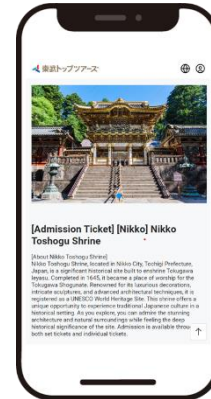
スマートフォン画面（イメージ）

東武観光インフォメーションセンター浅草と東武日光駅観光インフォメーションセンターでは、旬の観光情報やちょっとした日々の出来事をXでポスト(ツイート)しています。