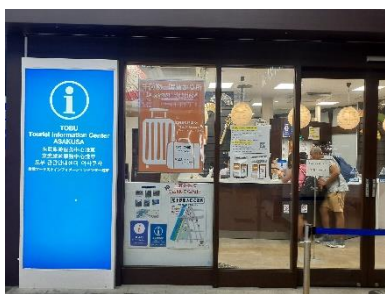
東武観光インフォメーション センター浅草

当社は、東武鉄道浅草駅構内にてインバウンド向けインフォメーションセンターの運営受託、東武日光駅・鬼怒川温泉駅構内にてツーリストセンターの運営を実施しています。このたび、浅草や日光・鬼怒川温泉を訪れるインバウンド旅行者のために、東武鉄道浅草駅、東武日光駅、鬼怒川温泉駅でのご案内・サービスに加え、新たに移動中の東武鉄道車内でも着地型観光商品の予約・決済が可能な販売サイトを開設します。これにより、旅行者は現地に到着後、スムーズに目的とする観光や体験を楽しむことができるほか、それぞれの拠点において、インバウンド旅行者とのタッチポイントを持つ当社の強みを発揮し、よりきめ細やかで高付加価値な商品・サービスの提供を目指してまいります。