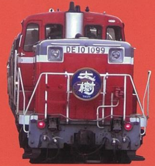
DL 大樹 (色が変わる場合がございます)

会津冬の魅力、会津絵ろうそくまつりと大内宿の雪景色 をご案内します。復路に DL 大樹で会津田島→下今市乗車 ・ノスタルジックな夜汽車気分をお楽しみ下さい。