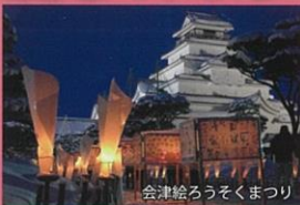
会津絵ろうそくまつり