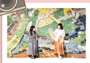
三井楽教会 イメージ