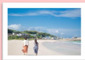
高崎海水浴 イメージ