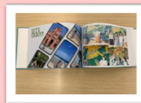
アルバム イメージ