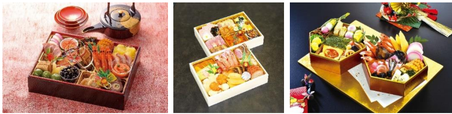
高校生の考案した地域のおせち（イメージ）

東武トップツアーズ株式会社（本社：東京都墨田区、社長：百木田康二）は、全国の高校生が考案した当社オリジナルおせち 10 商品をはじめとする全 75 商品を 10 月 1 日（金）より発売することをお知らせいたします。