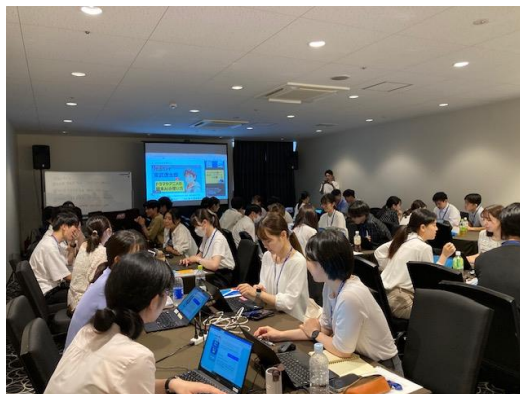
キックオフ合宿の様子